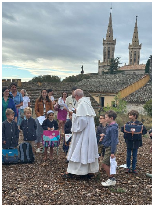
Bénédition des enseignants

« Dieu notre Père, écoute la prière de ces enfants qui te présentent aujourd'hui leur cartable comme symbole de leur travail. Donne-leur de grandir tout au long de cette année dans la foi l'espérance et la charité, et prépare-les toi-même à la mission que tu veux leur confier pour leur bonheur et ta gloire. Bénis également leurs enseignants et tous ceux qui travaillent au service des enfants."